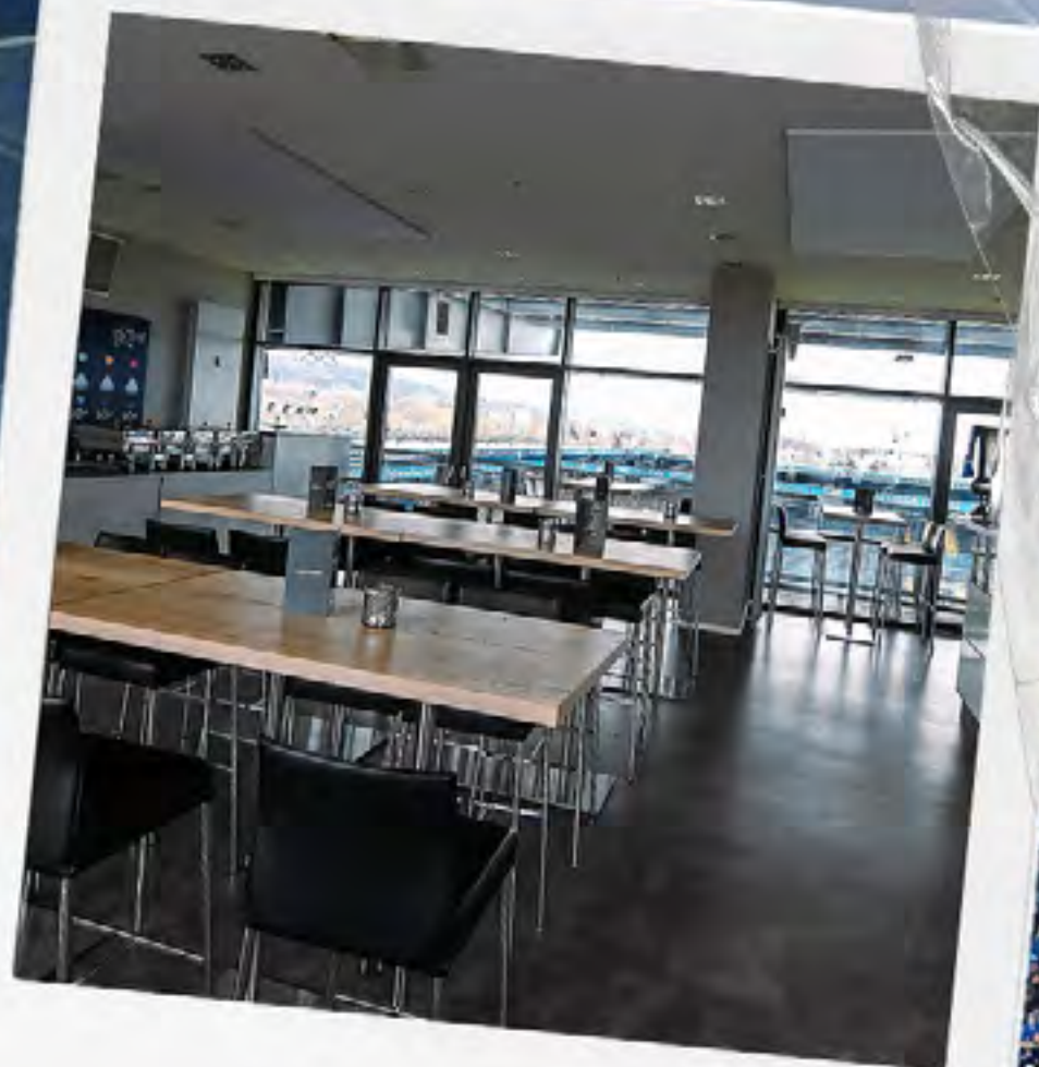
BLICK IN DIE LOGE