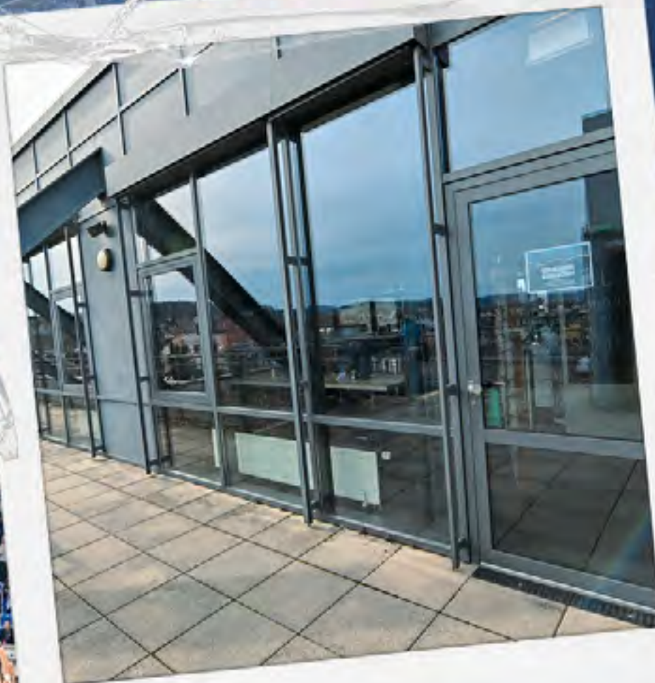
ZUGANG ZUR LOGE